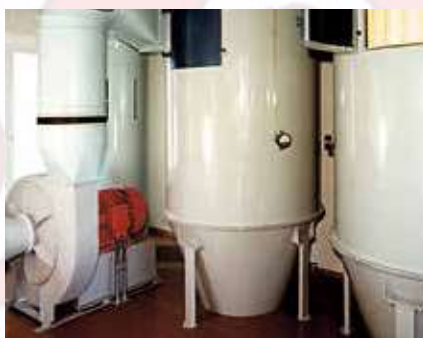
Caïsson de filtre