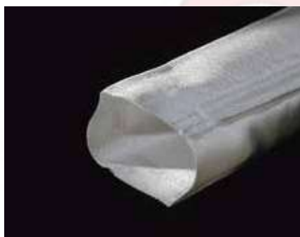
Manche de dépolluissage, entrée

D'autres dimensions peuvent être confectionnées sur commande.