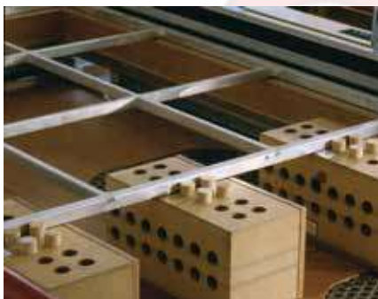
Support et ecarteur