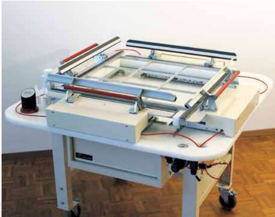
Système complet de tension pour un cadre

Les trois dimensions de pinces (largeurs de mâchoire) et l'unité de contrôle permettent d'avoir un système pratique et fiable qui convient à toutes les tailles de cadres et tous les types de tissus. Les connecteurs pneumatiques favorisent la reconfiguration aisée du dispositif.