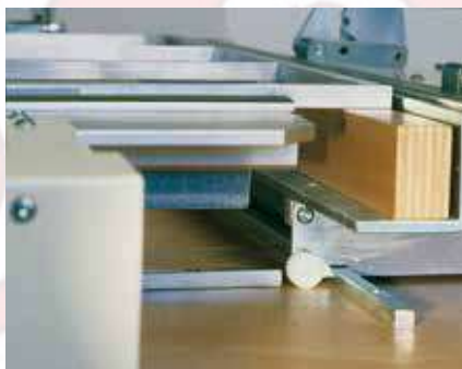
Support de cadres